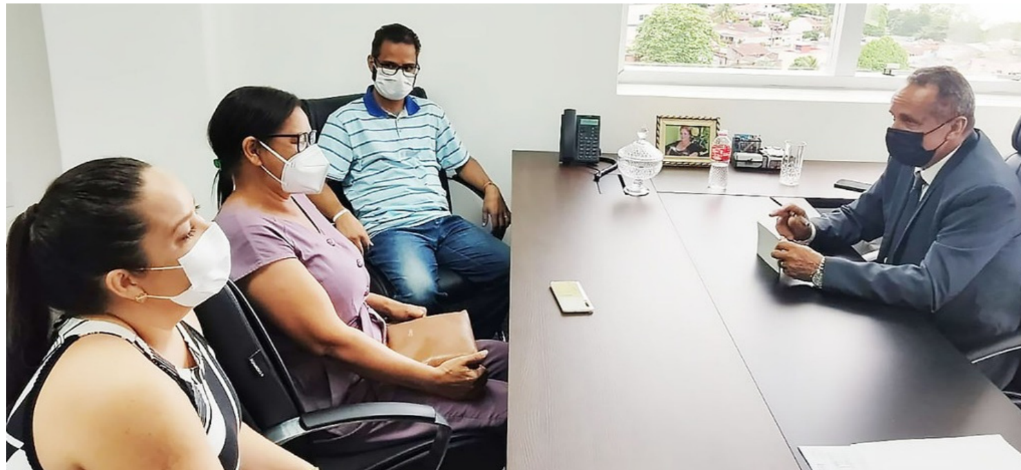
EM PAUTA - Assejus/RO e CUT/RO participam de reunião na ALE para agilizar o pagamento dos Servidores do TJ/RO