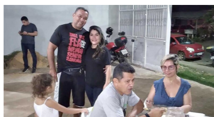
UMA BOA OPÇÃO - Sopa da Amizade reúne servidores, todas as terças-feiras