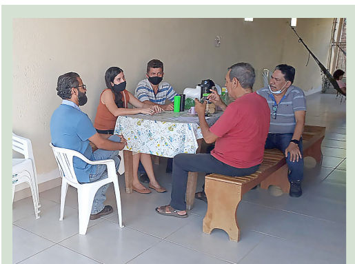
Com atendimento humanizado, os servidores preferem a Assejus no atendimento das demandas

Atenção servidor aposentado e pensionista, associado da Assejus, talvez não saiba, mas você pode ter direito a esse importante benefício, nos procure e saiba como adquirir essa isenção que é garantida por Lei.